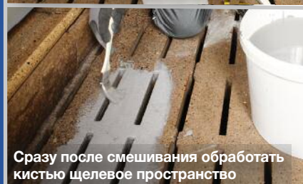
Сразу после смешивания обработать кистью щелевое пространство