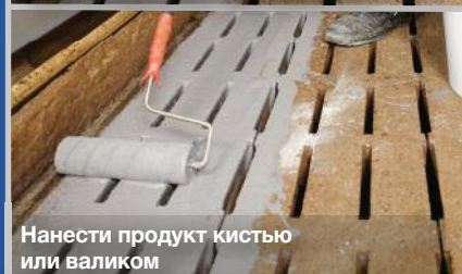
Нанести продукт кистью или валиком

Подробная информация на сайте www.remmers.com.ru