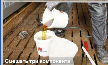
Смешать три компонента